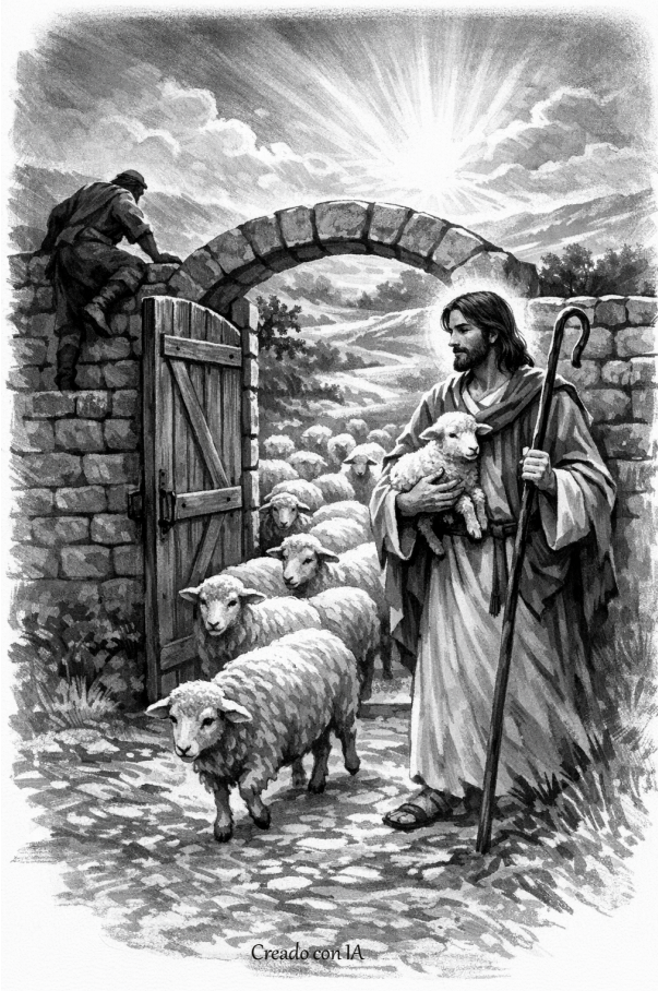
Creado con IA

«Yo soy la puerta: quien entre por mí se salvará y podrá entrar y salir, y encontrará pastos.» Jn 10, 9