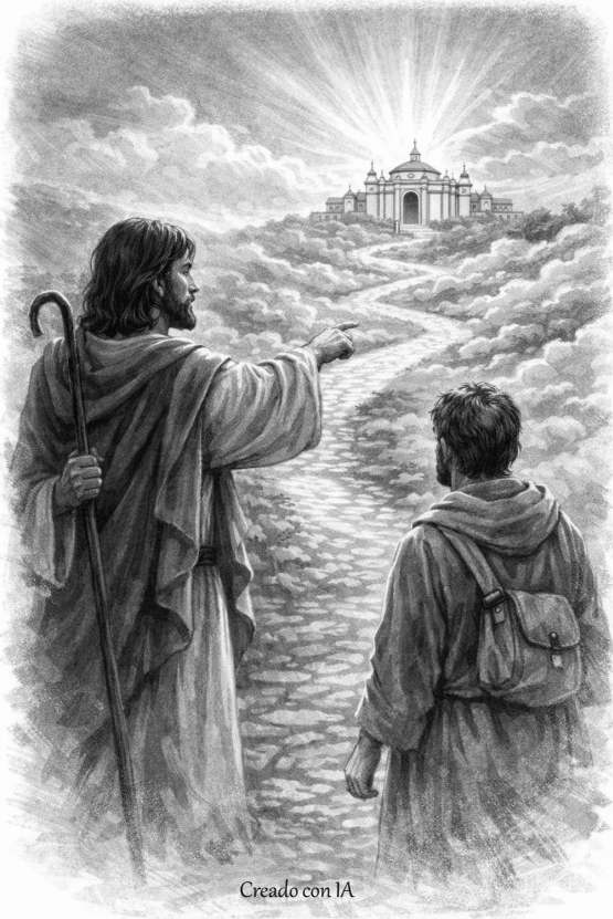
Creado con IA

«El que cree en mí, también él hará las obras que yo hago, y aun mayores, porque yo me voy al Padre.» Jn 14, 12