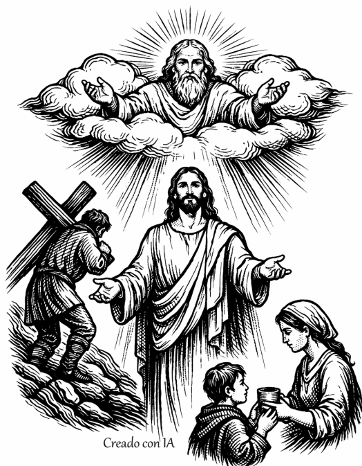
Creado con IA

«El que encuentre su vida la perderá, y el que pierda su vida por mí, la encontrará.». Mt 10, 40